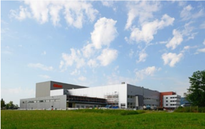
Das neue Stanzwerk, das künftige Werk 8 von Blum, in Dornbirn: die 1. Bauetappe konnte im Juli bezogen werden, die 2. folgt im April 2019

Der Österreichische Beschlägehersteller Blum schloss das Wirtschaftsjahr 2017/2018 mit einem neuerlichen Umsatzwachstum von 50 Mio. Euro ab.