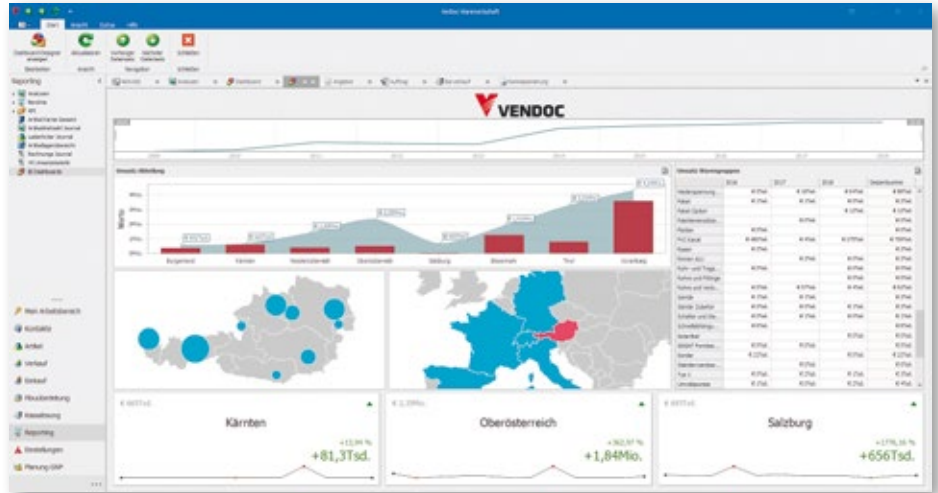
Das mächtige BI-Dashboard-Werkzeug erhalten die Anwender im Zuge der Wartung kostenlos.