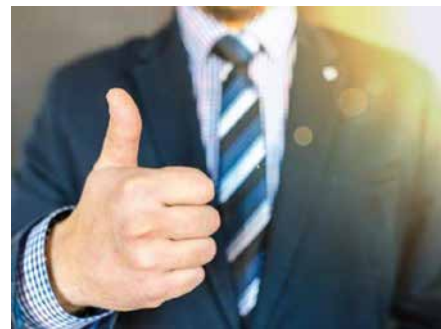
Anerkennung steht bei Mitarbeitern hoch im Kurs

Positives Feedback gibt uns das Gefühl, geschätzt zu werden. Vor diesem Hintergrund bewährt sich ein kontinuierlicher Feed-back-Zyklus als Dreh- und Angelpunkt des Leistungsmanagements.