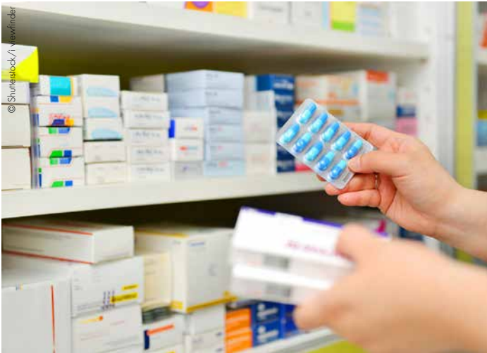
Ein Forschungskonsortium prüft, ob eine KI-gestützte Prognose von Medikamenten-Engpässen zulässig ist.