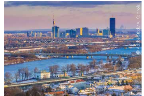
Eine zukunftsorientierte Politik braucht unbedingt neue Impulse.

Europas Rolle in einer polarisierten Welt Im Spannungsfeld zwischen den USA und China sowie angesichts neuer Herausforderungen im transatlantischen Verhältnis muss Europa eine klare Position finden, um wirtschaftliche Stabilität und politische Handlungsfähigkeit zu sichern, betont Mitterbauer. „Vor diesem Hintergrund, freut es uns sehr, dass wir die Herausforderungen für Europa und auch die Notwendigkeit einer starken Positionierung Europas mit Frau Marin diskutieren können.“ Sanna Marin, ehemalige Ministerpräsidentin Finnlands, war als eine der jüngsten Staatsoberhäupter der Welt bekannt und hat während ihrer Amtszeit eine beeindruckende politische Bilanz vorzuweisen. Mit innovativen Ansätzen im Bildungs- und Gesundheitssystem, einem umfassenden Klima-