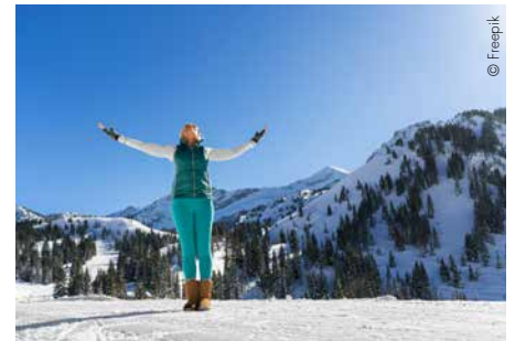
Fokus auf Tourismusakzeptanz, regionale Wertschöpfung und Entlastung