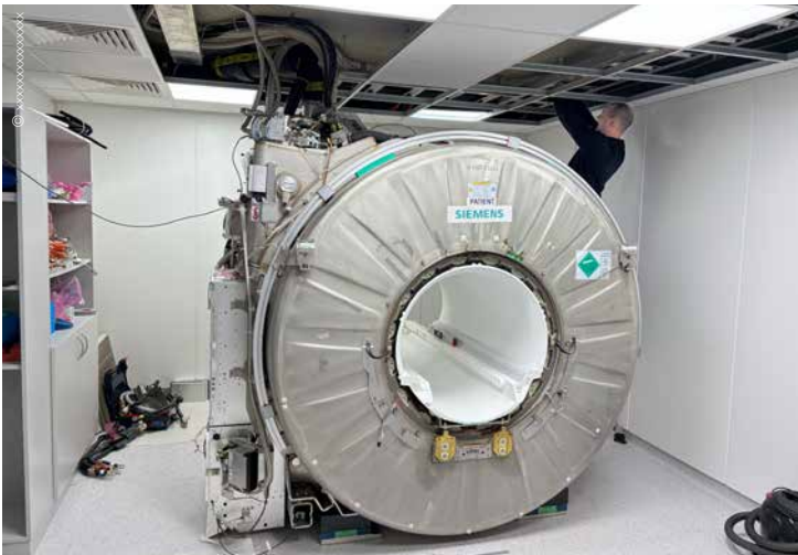
Die neue MRT-Technologie ermöglicht präzise Herzdiagnosen ohne Eingriff, senkt Kosten und erspart vielen Patienten den Herzkatheter.