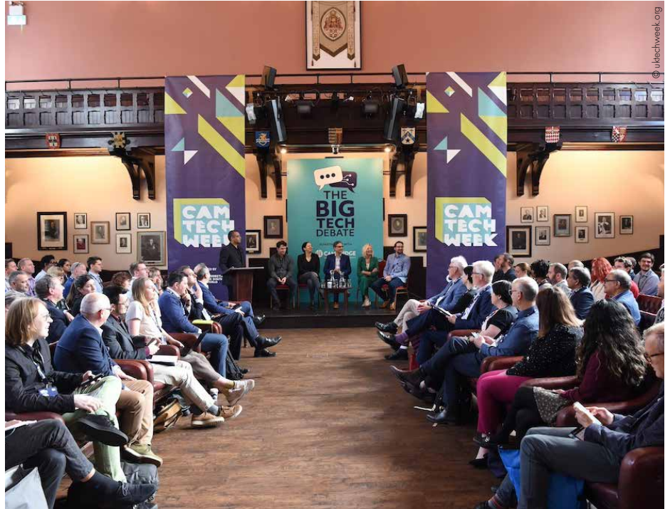
Österreich zeigt technologische Spitzenleistungen auf internationalen Innovationsbühnen 2026 – wie z.B. auf der Cambridge Tech Week.