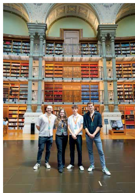
Anzeige • Fotos: Huawei