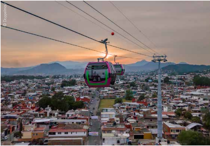
Doppelmayr bringt urbane Mobilität nach Uruapan.