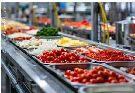
Die Lebensmittelindustrie setzt ein Zeichen für mehr Sachlichkeit in der öffentlichen Debatte.

stagnierten nahezu, während die Importe um 0,9% über dem Vorquartal lagen. Die WIFO-Schnellschätzung ist eine erste Schätzung für das vergangene Quartal. Sie baut auf der Quartalsrechnung von Statistik Austria auf und umfasst das BIP sowie Komponenten in der Form von saison- und kalenderbereinigten Veränderungsrate gegenüber dem Vorquartal. Am 5. Juni 2026 werden von Statistik Austria die Quartalsdaten für das BIP und die Hauptaggregate für das I. Quartal 2026 auf Basis vollständigerer Daten veröffentlicht. www.wifo.ac.at