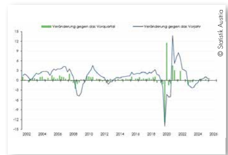
Langfristige Entwicklung des realen Bruttoinlandsproduktes

Entwicklung des Bruttoinlandsproduktes Im Bereich der sonstigen wirtschaftlichen Dienstleistungen (ÖNACE 2008, Abschnitte M und N) blieb die Dynamik verhalten (-0,4%), die übrigen Dienstleistungsbereiche entwickelten sich hingegen positiv. Auf der Nachfrageseite stützte die Konsumnachfrage die Konjunktur. Der Konsum der privaten Haushalte (einschließlich privater Organisationen ohne Erwerbszweck) stieg um 0,8%, die öffentliche Konsumnachfrage legte um 0,4% zu. Auch die Bruttoanlageinvestitionen wurden ausweitete (+1,0%). Die Exporte