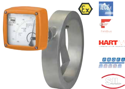
Stauklappen-Durchflussmesser / wächter