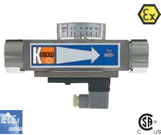
Viskositätskompensierter- Durchflussmesser / wächter Ganzmetall