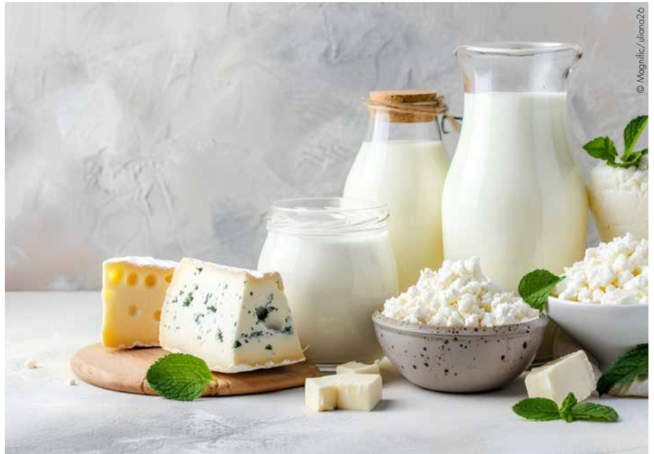
Zum Weltmilchtag stehen gesunde Ernährung, Qualität und Nachhaltigkeit im Mittelpunkt.

Die Struktur der Milchwirtschaft unterscheidet sich international stark. Während in Industrieländern große Mengen industriell verarbeitet werden, stammt in vielen Entwick-