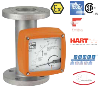
Ganzmetall Schwebekörper Durchflussmesser / zähler

Ausgewählte Produkte aus unserem Programm unter www.kobold.com finden sie die ganze Vielfalt