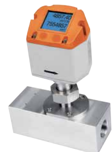
Inline thermischer Durchflusssensor

DURCHFLUSS • DRUCK • FÜLLSTAND • TEMPERATUR • pH-WERT/REDOX • LEITFÄHIGKEIT • FEUCHTE • TRÜBUNG • DICHT