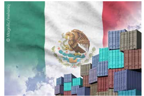
Impulse für Österreichs Exportwirtschaft: Verbesserungen für Dienstleistung und Landwirtschaft

Mehr Warenexporte nach Mexiko Österreich exportierte im Vorjahr Waren im Wert von rund 1,8 Mrd. Euro nach Mexiko und erwirtschaftete dabei einen Handelsbilanzüberschuss von 1,2 Mrd. Euro. Mexiko ist damit der wichtigste Absatzmarkt in La-