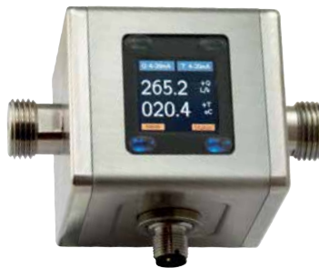
Magnetisch induktiver Durchflussmesser